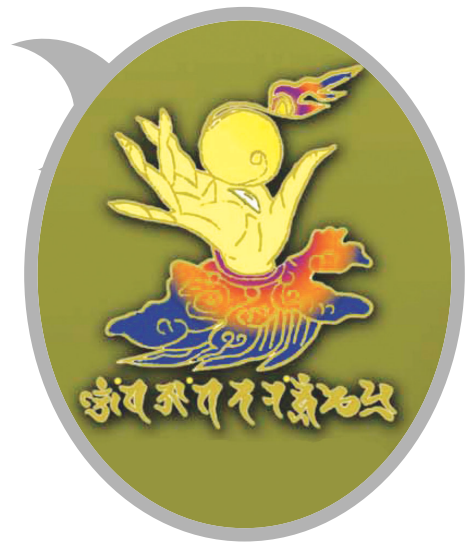
42수진언 족자 중의 '여의수주 진언' 확대사진