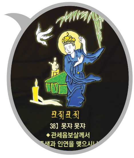
신묘장구 대다라니 족자 중의 '못자못자' 확대사진

법보시용으로 탁월하며 각 가정에 행운과 복을 선사합니다. 10개 이상 구매시 원하시는 문구를 새겨 드립니다.