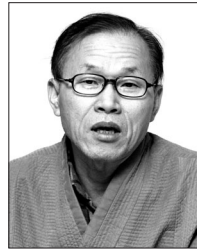
글 · 윤창화 (인족사 대표)

시심마(是心) '하루 10시간씩 앉아 있는 나는 누구인가?' 이것이 살아 있는 진정한 화두 '오늘의 시심마'이며, 오늘을 살아가는 우리 모두에게 주어진 철학적인 주제이다.