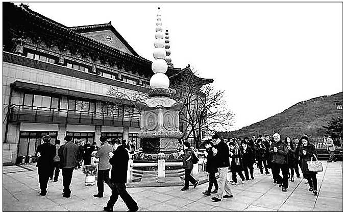
한마음선원은 분원 중창불사와 함께 어린이·인터넷 포교를 통해 불법 흥포를 하고 있다. 안양 본원 도량에서 탑돌이를 하고 있는 불자들.