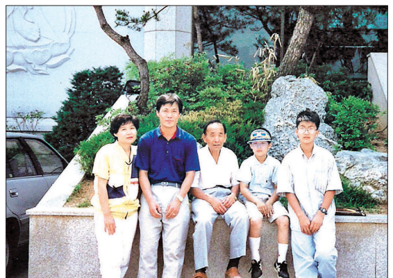
곽 단장의 가족사진. 가운데가 곽 단장의 시아버지이다.

2000년 이후 곽 단장은 본격적으로 중앙 포교사단에서 일하기 시작했다. 포교, 환경, 복지, 문화 등 14개 분야에서 팀이 꾸러지는 동안 포교사가 뭐하는 직업이냐고 묻는 사람들을 많이 만났다. 군대, 경찰은 물론 통일, NGO 등 여러 곳에서 활동 범위를 넓혀왔는데 이를 모른다니 아니다 싶었다. 포교사단 내 홍보팀을 꾸렸다. 홈페이지도 만들고 자비로 구입한 카메라로 활동모습을 찍은 사진을 불교 언론사 등에 보내며 포교사들의 활약상을 불자들에게 알렸다. 또한 전국의 지역단마다 2명의 홍보위원을 두어 활동내역을 홈페이지에 게재, 서로 포교 노하우와 정보를 공유하는 포교사 커뮤니티를 구축했다. 이렇게 전국 각지에서 올라온 포교사들의 이야기를 바탕으로 월보와 뉴스레터