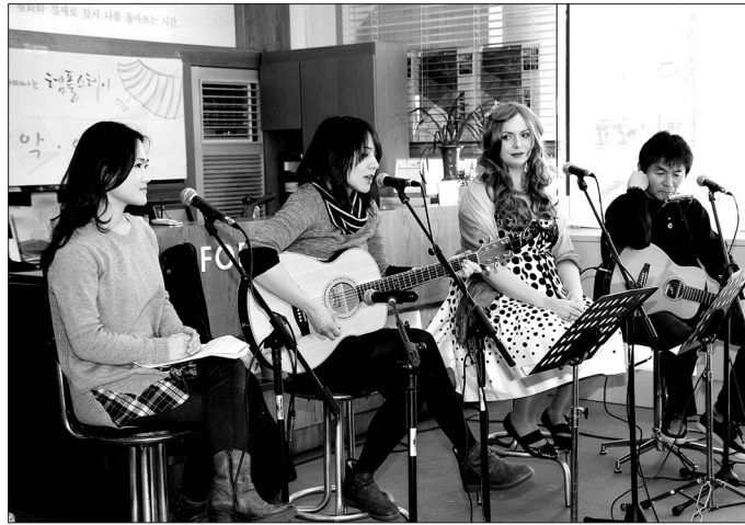
이날 행사에는 불교여성개발원의 '불교 여성 다문화 봉사단'을 통해 연결된 중국, 베트남, 캄보디아에서 온 이주여성 및 다문화가정과 자원봉사자 70여 명이 참여해 즐거운 시간을 가졌다. 콘서트에서는 '이등병의 편지'로 유명한 김현성과 인디밴드 '레드로우 밴드', 포크록 밴드 '레'를 비롯해 템플스테이 홍보서포터즈들의 노래공연이 펼쳐졌다.