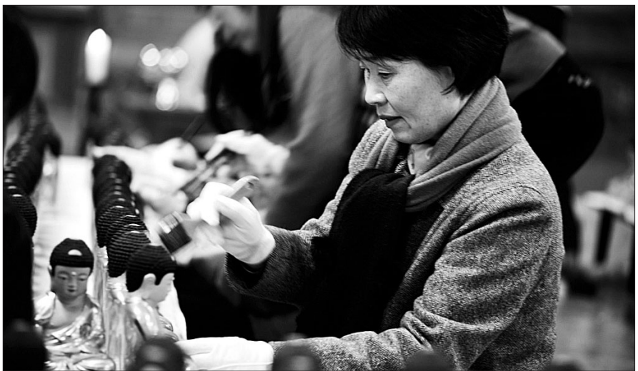
열린선원 신도들이 정성스럽게 붓으로 불상에 묻은 먼지를 털어내고 있다.