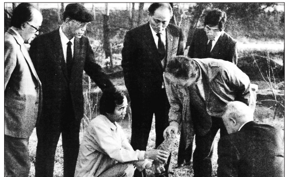
1974년 '마한백제 문화연구소'의 미륵사지 발굴조사 장면