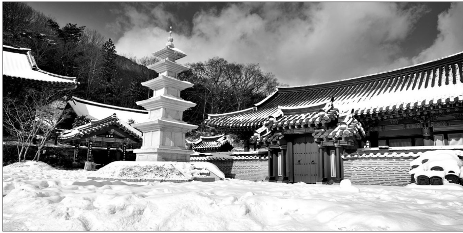
광주 원효사 일대 전경. 광주시는 이 지역을 치유와 건강을 위한 생명 지구로 거듭나게 할 계획이다.

원효사지구 정비사업과 관련해 무등산에는 2010년 완료된 증심사지구 정비사업이 선행로 남아있다. 2002년에 시작된 증심사지구 정비사업은 당시 무질서하게 늘어서 있어 사찰을 찾는 신도들과 등산객들에게 눈살을 찌푸리게 했던 낡은 음식점과 상가를 모두 이전시켜 새롭게 단장했다. 8년 동안의 정비사업 이후 증심사지구는 시민들의 문화휴식공간으로 거듭났다. 녹지공간이 확보됐으며 산행을 위한 시설도 마련돼 큰 호응을 얻었다. 상업지구엔 입주한 상가들도 깨끗이 정비된 이후 찾는 이들이