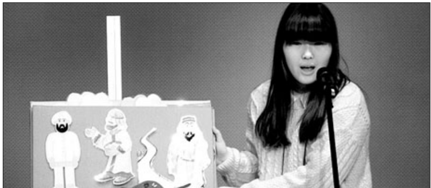
제7회 어린이 영문자타카 암송대회에 참가한 학생들이 자타카를 암송하고 있다.