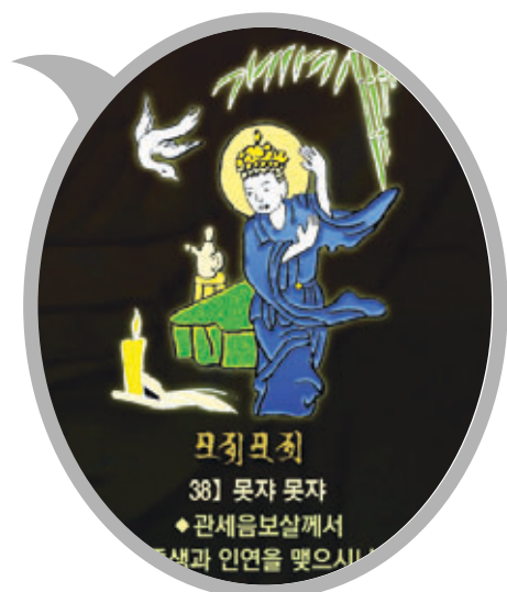
신묘장구 대다라니 족자 중의 '못자못자' 확대사진

법보시용으로 탁월하며 각 가정에 행운과 복을 선사합니다. 10개 이상 구매시 원하시는 문구를 새겨 드립니다.