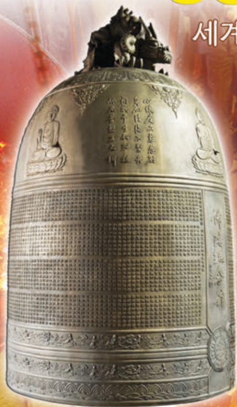
불광산사 범종 (중량 6700관)

최근 세계적인 범종 제작회사로 거듭나고 있는 성종사가 대만 최대 사찰인 불광산사 범종을 수수하는데 성공하였습니다. 대만 최대 규모인 6,700관 (25.5ton)으로 제작된 본 범종은 성종사 특허공법인 밀랍주조공법으로 제작되어 표면과 문양이 매우 매끄럽고 섬세할 뿐만 아니라, 음향측정 결과에서도 소리가 매우 웅장하고 맥놀이가 뚜렷하다는 극찬을 받았습니다.