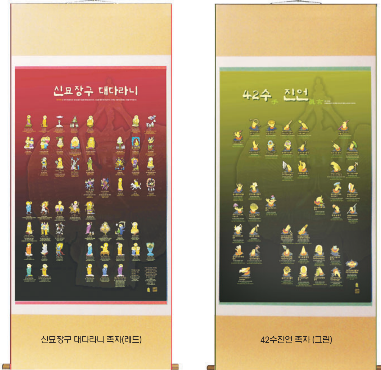
신묘장구 대다라니 족자(레드)