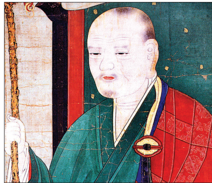
자생풍수의 비조 도선 국사