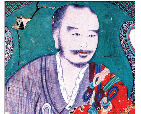
조선 건국의 주역 무학 대사