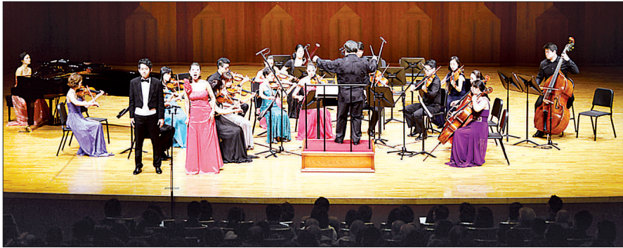
JK챔버오케스트라는 1월 19일 예술의전당 콘서트홀에서 가족콘서트 '영화를 만난 클래식'을 열었다.