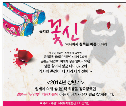
뮤지컬 '꽃신' 포스터

다. 국민들이 참여하는 크라우드 펀딩 방식으로 제작비를 마련할 예정이며, 재능기부로 절약된 제작비는 관람료를 낮추고 소외계층의 공연초청 등에 사용된다.