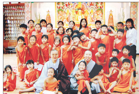
2004 인도네시아 해인사 포교원 어린이들과 함께

이렇게 비로자나국제선원에서 영어를 배운 어린이들은 자타가 압송대회 등에 나가 대상과 최우수상을 6년 연속해서 받아오는 쾌거를 이루기도 했고 연등축제 불교문화마당에 나가 외국인 어린이 손님들 맞아 불교를 설명해주는 재능을 발휘하기도 한다.