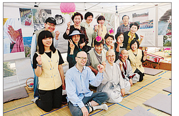
불교문화마당에 참여한 비로자나국제선원