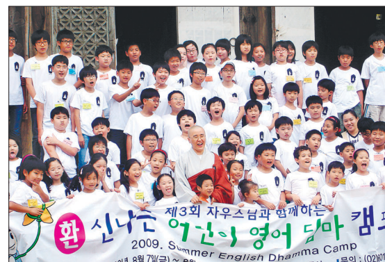
2009 여름 영어 법회 캠프