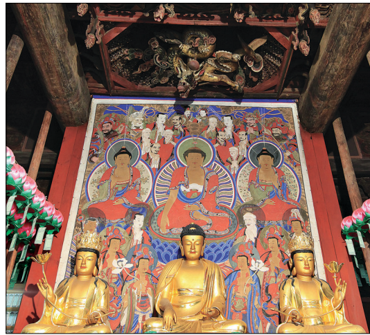
안쪽 벽화위 화려한 단집이 돋보이는 보광전 내부