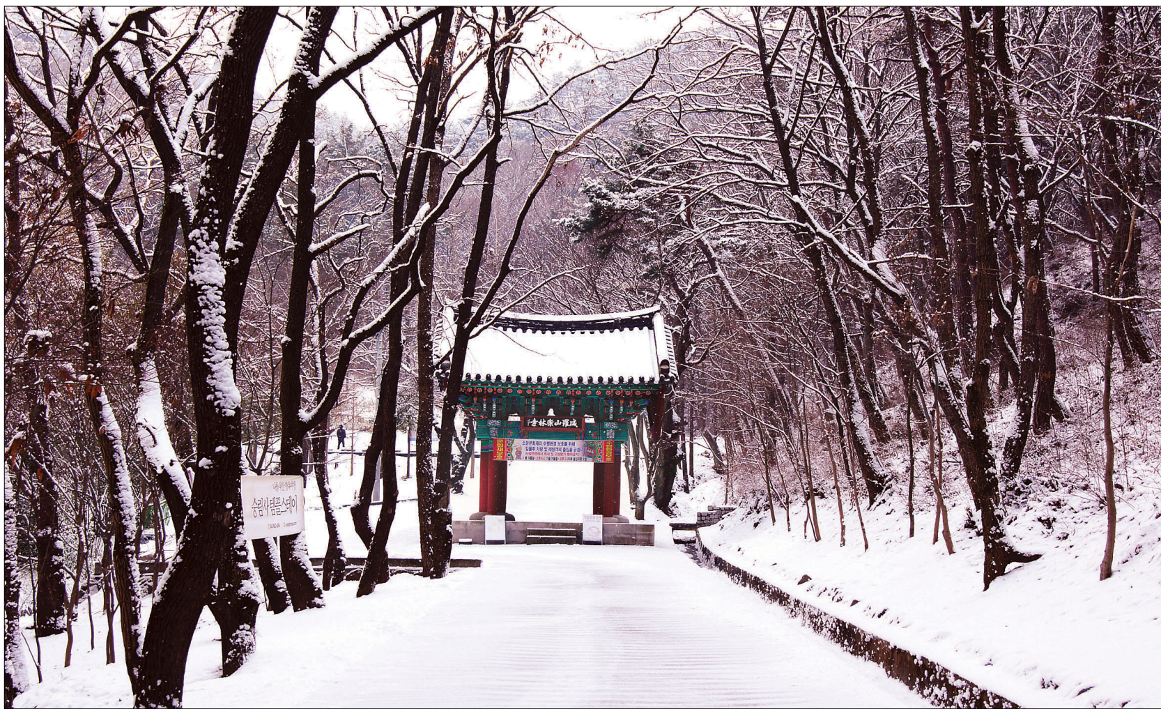
일주문 들어가는 길에 열병하듯 서있는 벚나무, 은사시나무, 굴참나무 위에 살포시 내려앉은 백설은 천년고찰의 고즈넉한 겨울 정취를 한껏 더 돋워준다.