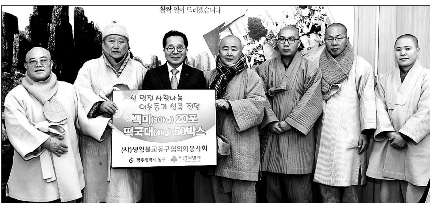
생활불교동구협은 1월 21일 광주 동구청을 찾아 떡국떡 50세대분과 쌀 20포대를 전달했다.