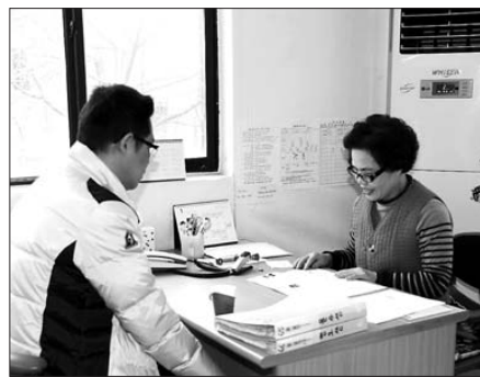
조계사에서 운영하는 좋은인연 ‘가피’에 남성 불자가 찾아와 가입 상담을 하고 있다(사진 왼쪽). 육천 대성사에서는 매주 일요일 법회와 함께 선남선녀 단체미팅을 실시하고 있다(사진 오른쪽)