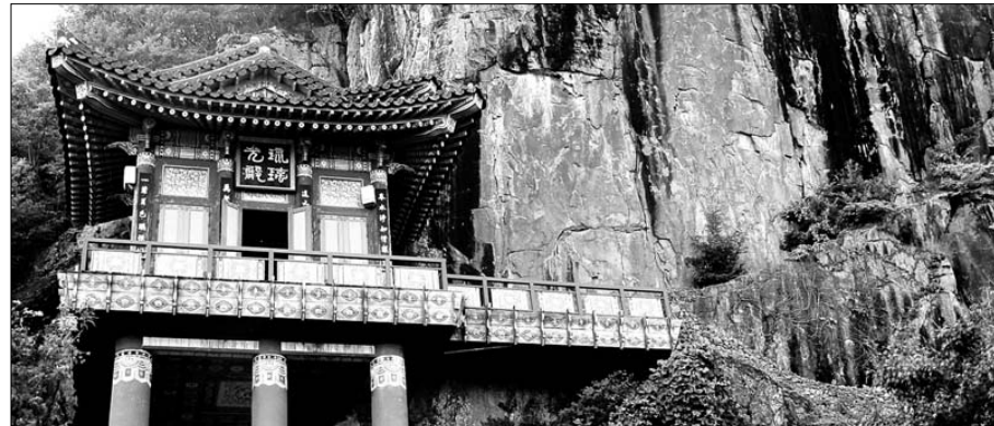
깎아지른 절벽에 걸쳐놓은 듯한 전각이 주변 자연과 어우러져 수려한 풍광을 자아낸다. 사진은 구례 사성암.

이 책은 천년의 역사를 지닌 우리나라 14곳 암자에 관한 이야기이다. 암자로 향하는 길목의 경관, 해당 암자들의 구조적인 아름다움과 역사, 전설, 설화 그리고 그곳을 거쳐 간 사람들에게 대한 자취와 업적 등을 기행문 형식으로 담았다. 강원도 설악산 봉정암에서 경남 김해 무척산 모은암까지, 온몸으로 역사의 질곡을 버텨 온 암자의 사연들이 현장감 있게 묘사돼 있다. 깊고 울창한 숲을 지켜온 암자들은 세상과 등 돌린 것이 아니라, 천년 역사의 중심에 올랐기 때문이라는 증거를 찾아내려 한 시도인 것이다. 특히 감수성 넘치는