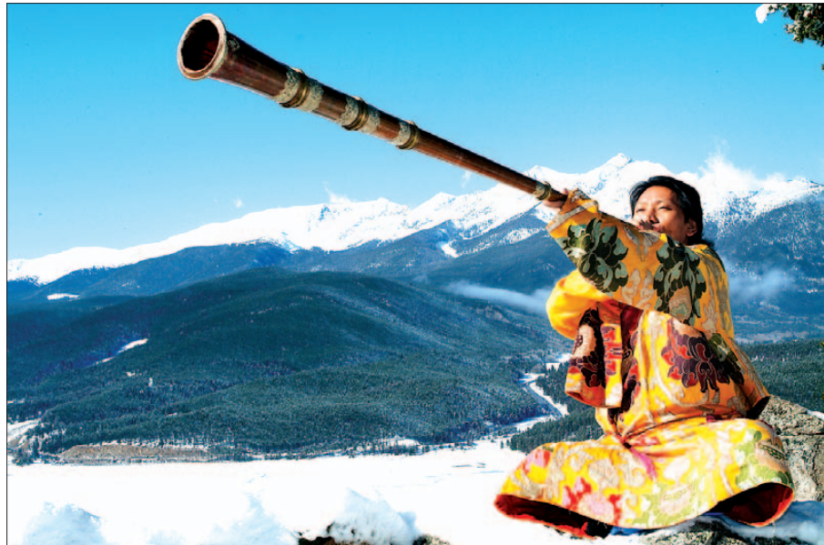
피리 연주가 나왕케족은 1988년 데뷔 이후 힐링과 명상을 담은 음악으로 대중들에게 평화의 소리를 전해왔다.

신비롭고 영적인 선율로 영혼을 깨우는 피리 연주가 나왕 케족의 데뷔 25주년 기념 2CD베스트 앨범이 콘텐트코리아에서 나왔다. 힐링과 명상, 티베트의 영적인 문화유산이 담겨있는 그의 음악은 세계적으로 7백만 장이 팔리며 큰 사랑을 받았다. 이번 앨범에는 그간 발매된 9장의 음반에서 엄선된 불멸의 힐링명상곡 베스트 22곡과 3곡의 신곡이 포함되어 있다.