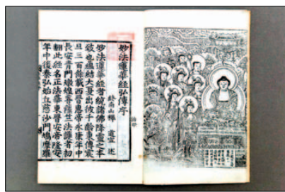
국립중앙도서관에는 전시중인 <묘법연화경>

경전 속 심화형태로 그려진 불화를 한꺼번에 볼 수 있는 기회가 마련됐다.