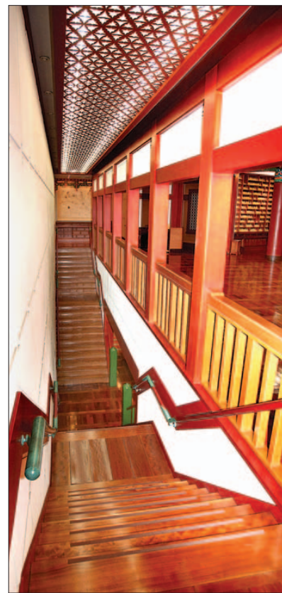
법당으로 오르는 계단 위 천정에 꽃문양을 형상화한 꽃문양이 새겨져있고 여덟 개의 기둥은 법당 뒤쪽에 해당하는 부분으로 허공을 배치했다.