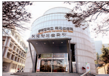
이해랑극장, 국제선센터와 함께 2~3층에 대각전이 있는 복합문화관