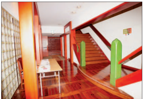
징검다리를 지나면 법당으로 오르는 계단이 나온다.