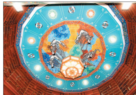
화려한 단청을 현대적으로 변형시켜 원형 천장에는 비천상을 넣었다.