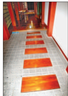
법당으로 오르는 길에 놓은 징검다리