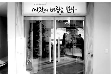
광주불교계에는 지난 12월 19일 개관한 선덕사 '밤살마를 사랑방과 작은도서관'이 유일한 작은도서관으로 등록됐다.

관한 선덕사 '밤살마를 사랑방과 작은도서관'이 유일한 작은도서관으로 등록되어 있으며, 대부분 주민자치위원회와 교회에서 작은도서관을 운영중이다.