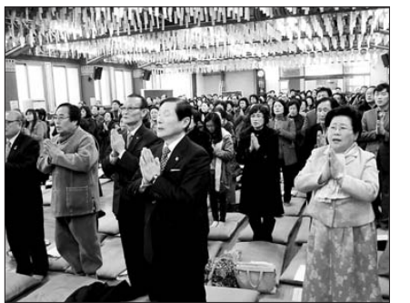
전북지역 불교발전과 지역 발전을 다짐하는 신년하례법회가 1월 11일 사부대중 300여명이 참석한 가운데 전북불교회관 4층 큰 법당에서 거행됐다.

성우 스님은 신년사에서 "각 사찰 주지 스님들과 함께 교육과 포교, 대종교화사업에 적극 임할 것이다"며 "내실있는 교