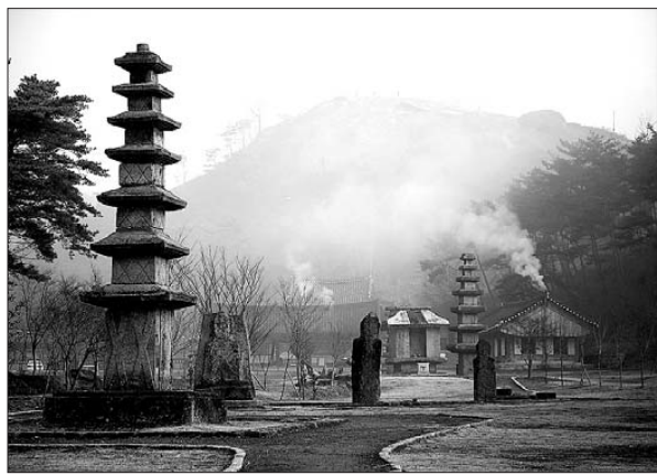
화순 운주사는 다양한 형태의 전불천탑으로 유명한 사찰이다. '신중동국여지승람'에 의하면 좌우 산등성이에 1000개의 석불과 석탑이 있었던 것으로 기록돼 있으며, 지금은 석탑 20여 기와 석불 80여 채가 남아 있다.

이번 국제학술대회에서는 운주사 관련 연구 활성화의 필요성 및 운주사의 세계유산으로서의 가치를 가능해 보는 국제학술