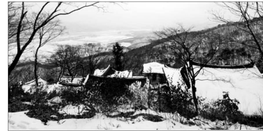
운길산에서 내려다 보는 수중사와 두물머리

문화재청(청장 나선화)은 경기도 남양주시 조안면 송촌리에 위치한 ‘남양주 운길산 수중사 일원(南陽州 雲吉山 水鍾寺 一圓)’을 국가지정문화재인 명승으로 지정 예고했다.