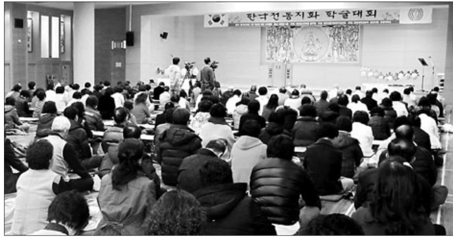
천태종이 1월 7일 단양 구인사 광명당에서 개최한 전통지화 학술대회에는 700여 대중이 모여 불교지화에 대한 높은 관심을 보였다.

천태종 교무부장 경혜 스님은 “지화는 지금까지 생화가 하지 못하는 역할을 했다”며 “부처님의 세계를 드러내는 지화에