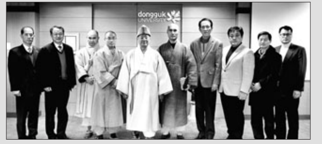
조계종 종정 진제 스님(사진 왼쪽에서 다섯번째)은 1월 6일 동국대 경주캠퍼스를 방문해 선센터 건립기금을 쾌척했다.

동국대학교 경주캠퍼스(총장 이계영)는 조계종 종정 진제 스님이 선센터 건립기금으로 금일봉을 쾌척했다고 밝혔다.