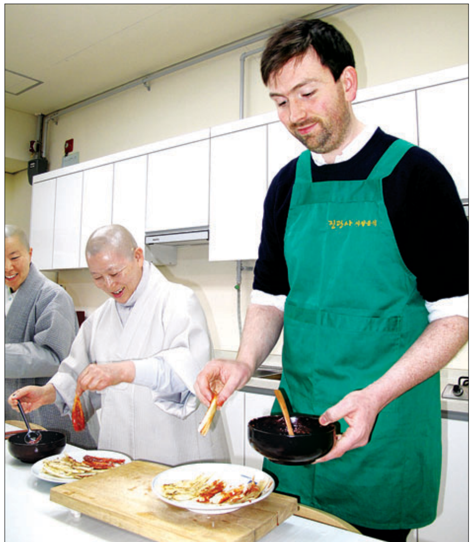
영국의 유명 셰프 스티브 파를레가 1월 10일 서울 진관사에서 주지 계호 스님의 지도로 사찰음식 체험을 하고 있다.