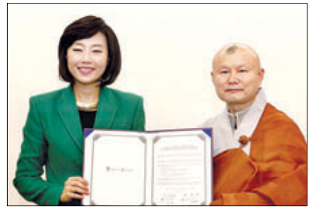
한국불교문화사업단과 여성가족부는 1월 10일 청소년·가족의 템플스테이 연계 및 지원을 위한 업무협약을 체결했다.

한국을 대표하는 전통문화체현으로 자리 잡은 것은, 그 만큼 참가자들에게 치유와 감동을 전하기 때문”이라며 “템플스테이를 통해 최근 우리 사회의 큰 문제로 대두되고 있는 청소년 인성교육과 가족 갈등해소를 위한 좋은 기회가 될 것”이라고 기대했다.