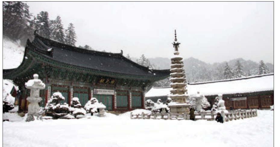
문수화엄의 성지로 불리는 오대산에 자리한 월정사

제1장, ‘오대산 월정사, 화엄의 으뜸 도량’에서는 인연이 있는 땅에 자장 율사가 가람의 터를 고른 일에서 시작하여 문수보살이 나타나 신에 이르기까지 화엄의 으뜸 도량이라는 공간에서 부처와 사람이 어울려 빛어낸 기억을 사실과 설화를 결합하여 풀어냈다. 자장율사가 월정사를 세우고, 신화 거사와 신의 두타가 중창하고, 산신과 부처가 하나가 되어, 성덕왕이 친히 이곳에 와서 화엄만다라를 경영하고 강릉 태수에게 이곳을 잘 보전하라는 전교를 내리는 바람에 아름다운 수로부인이