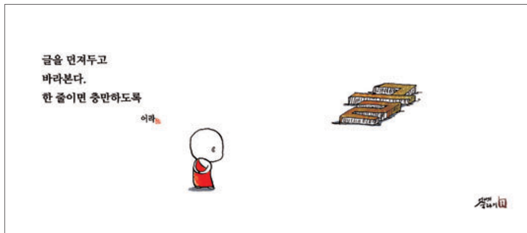
어라는 때로는 영동발랄하고 때로는 사유하는 모습으로 선적인 메시지를 던져준다. 그림 왼쪽은 '한 줄 충전', 오른쪽은 '붓다라떼 마음 심 한잔'