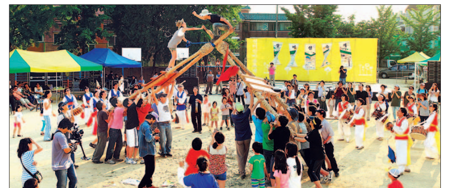
2011년 성미산 마을 축제 모습. 한국사회에서 가장 모범적인 마을 공동체로 전국 지자체가 벤치마킹을 하기 위해 찾고 있다.

스스로 진화해 온 성미산마을은 공동체의 가능성을 확대하며 다양한 실험을 시도하고 있다. 올해 만들어진 좋은날 협동조합은 학교를 졸업한 장애인들의 취업을 연계함으로써 노동력을 순환시킨다. 주민들이 만든 비누는 두레생협연합회를 통해 전국으로 판매되며 사회로 점차 발을 넓혀가고 있다. 배현진 기자