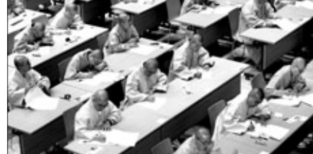
10월 30일~11월 2일 공주 전통불교문화원에서 4일간 진행된 조계종 제 2급, 3급 승가고교.

스님은 지난 1월에 방한해 8박 9일 동안 한국에 머물며 동국대 집중수행 인터뷰와 함께 안국선원 불광사 봉은사 조계사 구룡사 봉암사 등에서 법문을 펼쳤다.