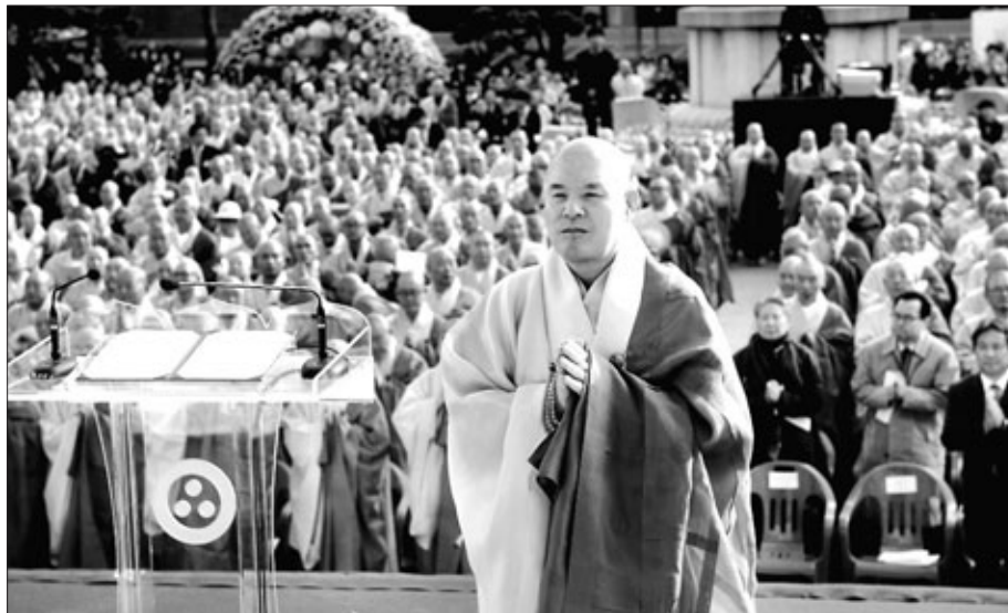
연임에 성공한 조계종 총무원장 자승 스님이 11월 8일 열린 취임식에서 삼귀의례를 하고 있다.

올 한해에도 해외 유명 수행자들의 방문도 이어졌다. 세계적인 명사가 아산 브람