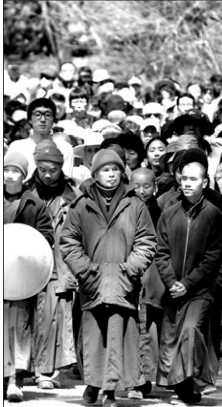
월정사는 5월 3일부터 7일까지 진행한 4박 5일간 틱낫한 스님 초청 명상 수행 지도 프로그램을 개최했다. 사진은 4일 진행된 월정사 천년의 숲 걷기 대회 모습.