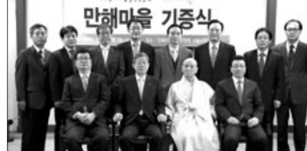
4월 3일 열린 만해마을 동국대 기증식에서 참가자들이 기념촬영을 하고 있다.