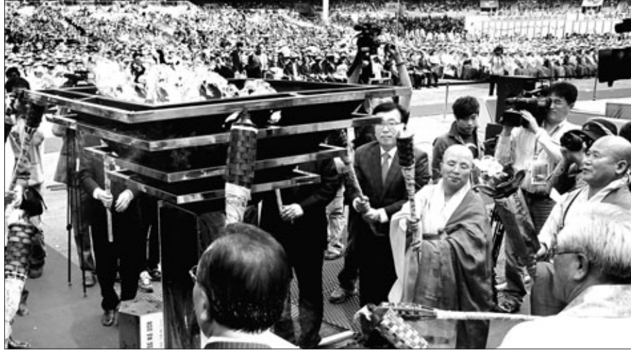
9월 27일 부산아시아드주경기장에서 열린 한국전쟁 정전60주년 한반도평화대회에서 평화의 불이 사부대중의 염원 속에 안착되고 있다.