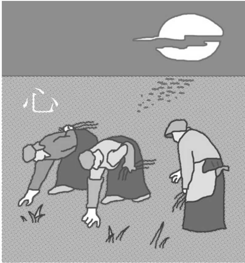
그림 · 박구원

비록 그대가 자그마한 도리를 얻었다 하더라도 그것은 다만 마음으로 헤아리는 법일 뿐이요, 선도(禪道)와는 전혀 상관이 없는 것이다. 달마스님께서 면벽하신 것은 사람들로 하여금