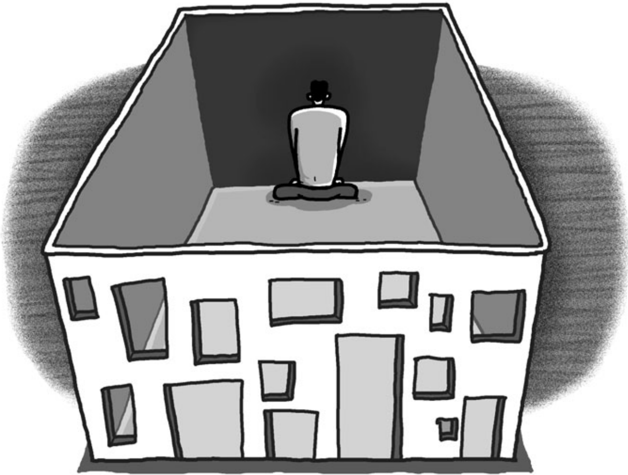
그림 · 최주현

옛날에는 당나귀 끌고 다니던 마부가 많이 있었죠. 당나귀를 끌고 다니는 마부가 얼마나 때리고 일을 부러먹었는지 당나귀가 앙심을 먹고 죽어서 그냥 남편으로 태어나고 마부를 부인으로 해서 맞아들였어요. 하하하... 그 래 가지고는 나갔다 들어오기만 하면 그냥 때리는 겁니다. 그러니 어떻게 삽니까? 옛날에 야합부로 이혼도 못하고 시집도 마음대로 못 갔으니 말이죠. 그러니까 그냥 울면서, 내가 무슨 죄를 지어서 이러냐고, 자기가 지은 죄는 모르구요, 아, 이려고 울고불고 그러는데 어느 스님이 탁발을 하러 오셨더라고요. 그래서 그 스님한테 “저는 하나 성한 데가 없이 이렇게 매를 맞고 삽니다.” 하니깐 꺾꺾 꺾꺾 스 스님이 웃으면서 “한때는 자네도 그 사람을 그렇게 때렸네.” 그러더라고요. 허허. 그래서 그게 무슨 말씀이냐고 그러니까 그 얘기를 쭉 해 주면서 “먼저 맞은 놈은 지금 그렇게 때리고 가는데, 그것도 자기 마음으로 자기가 어떡할 수가 없다. 그것도 억지로 하는 일이 아니야. 인과로 인해서 주어질 거니까. 그러니까 그 때린 대로 맞아야 하는데 아직도 말았다. 죽을 때까지 맞아도 안돼. 그러니까 못자리를 도르르 말아서 아주 고무줄로 창창 둘러매 가지고 손싸게 쥐고서 때리 게끔, 다른 건 다 치우고 그렇게 몇 번만 하라. 그러면 당신이 그 당나귀를 그렇게 피가 맺히도록 때린 것이 다 없어지노라.”고 그러더라고요.