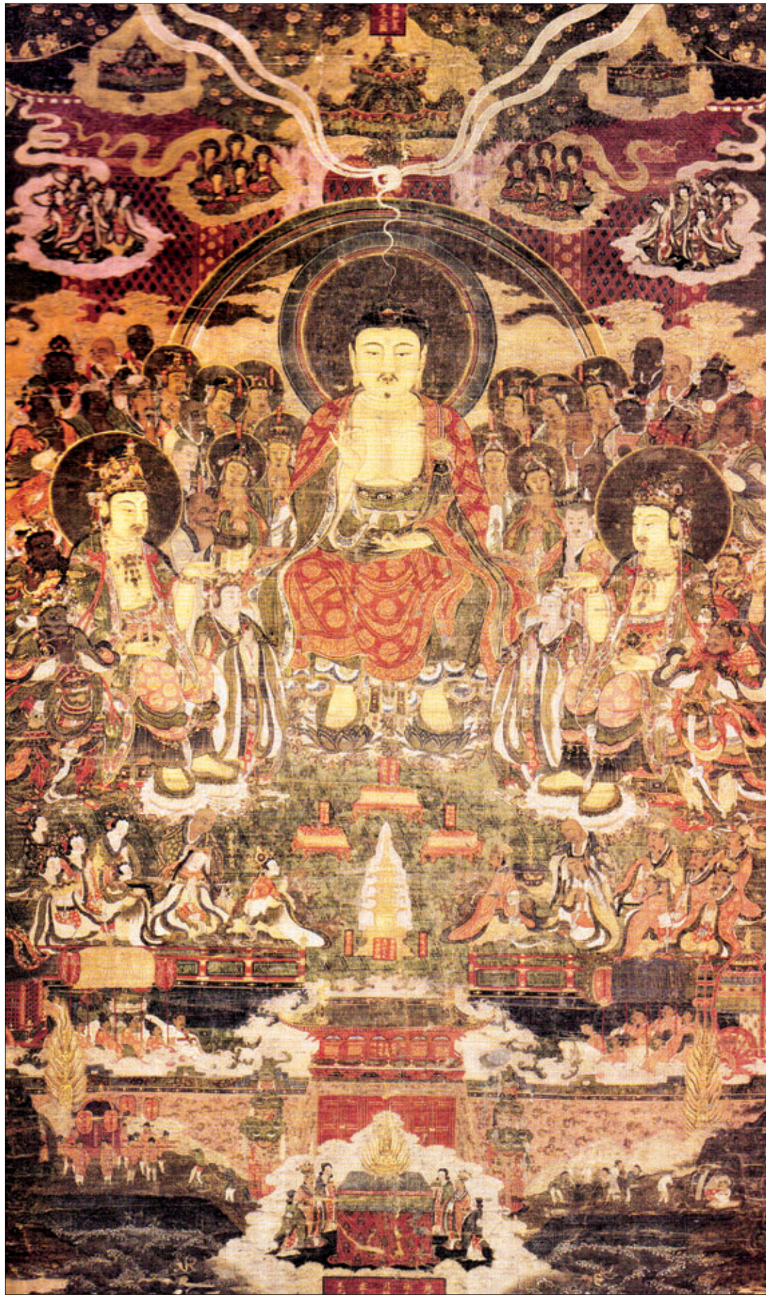
일본 서부서에서 소장된 ‘관경심육경변상도(202.8 x 129.8cm, 비단에 채색, 고려 시대)’. 정토삼부경 가운데 하나인 <관무량수경>의 <정종본>을 도해한 장면이다. 불교의 극락 정토에 왕생할 수 있는 열여섯 가지 관상법과 그 이후 나투는 아미타 정토의 장엄한 모습을 자세하게 풀어 그렸다. 가운데가 삼단으로 나뉘어 있는데 상품, 중품, 하품의 중생들이 연꽃에 연꽃으로 태어나고 있다.

제9관을 통해 마침내 아미타부처님의 진신을 친견하고, 이어서 관세음보살과 대세지보살의 진신도 친견한다. 아미타불을 보았을 때의 감격과 아름다움을 경전에서는 다음과 같이 기록하고 있다.