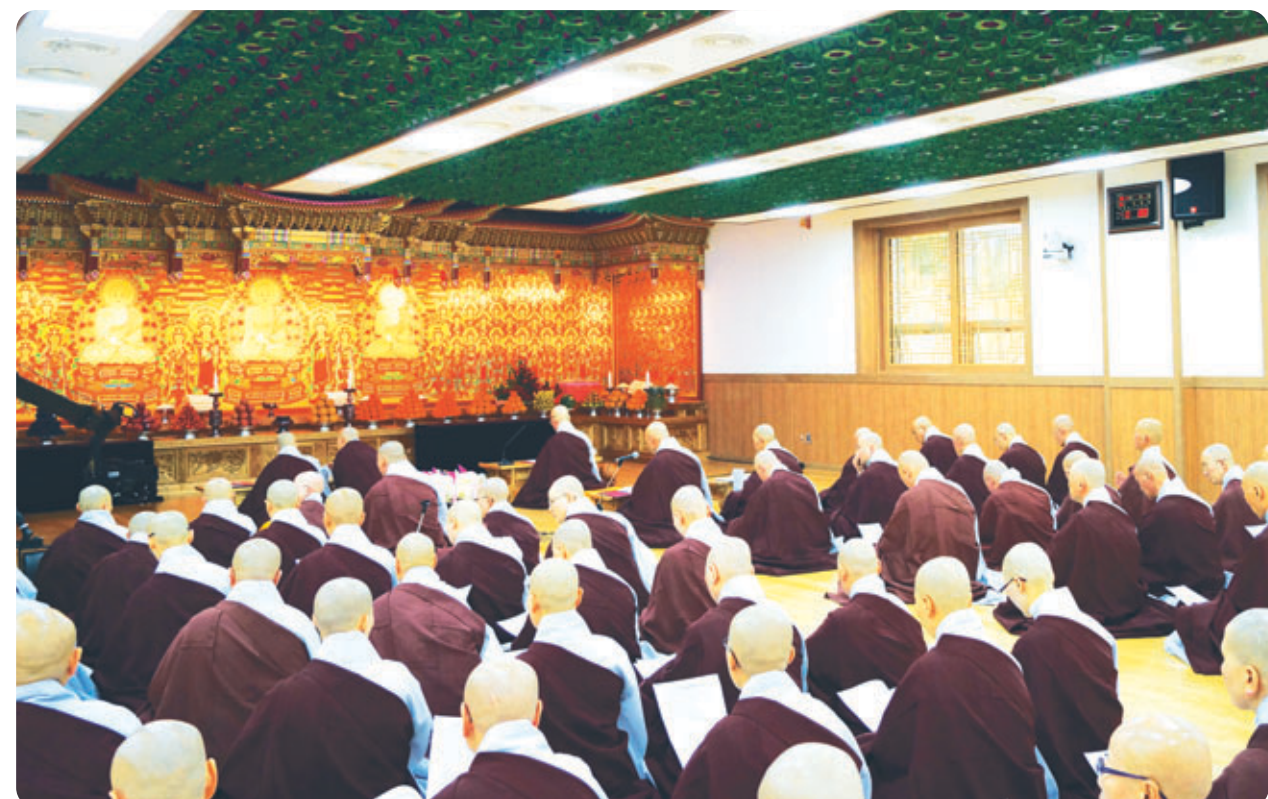
약사삼존불을 봉안하는 점안식 약사여래부처님과 좌우보처 일광불 일광변조보살님 월광불 월광변조보살님께 스님들이 공양을 올리고 있다

중생의 고통중에 병고만한 것이 없습니다. 지중한 병고는 대부분 전생의 업장이 발현한 것으로 현대의학으로도 고칠 수 없습니다. 이런 불치병 난치병을 약사여래부처님의 가피로 치유합니다. 의중대왕이신 약사여래 부처님께서 업장소멸과 병고치유로 병마에 신음하는 분들에게 희망을 열어드립니다.