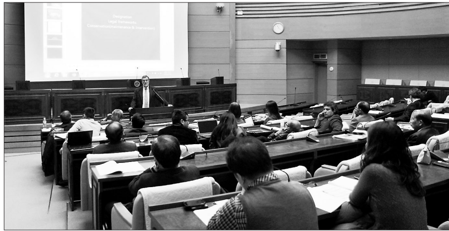
문화재청이 12월 6일 한국불교역사문화기념관에서 개최한 국제포럼에서는 불교문화유산을 적극적으로 활용해야 한다는 주문이 쏟아졌다.

세계적인 휴일 증가 추세에 맞춰 성지순례를 비롯한 불교문화 상품의 개발이 필요함을 역설했다.