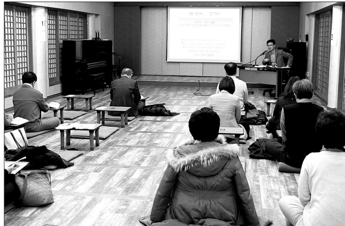
조계사 선림원은 간화선에 대해 탄탄한 이론을 정립하고, 선체험을 할 수 있도록 가르치고 있다. 조계사 안심당에서 진행하고 있는 참선입문 9기 수강생들이 수업을 듣고 있다(사진왼쪽). 화두 참선중인 선림원 학생들(사진 오른쪽).

현재 선림원은 참선입문 9기를 모집해 11월 12부터 매주 화요일 저녁 7시 조계사