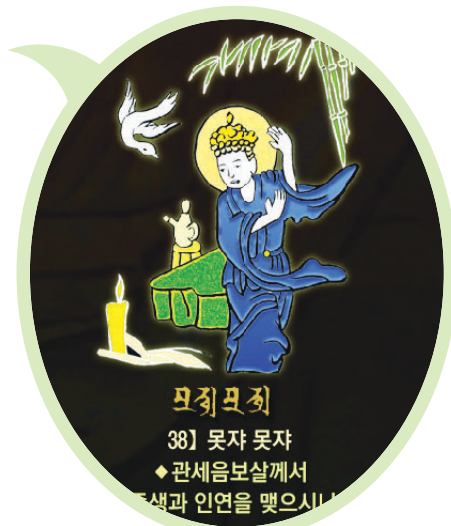
신묘장구 대다라니 족자 중의 '못자못자' 확대사진