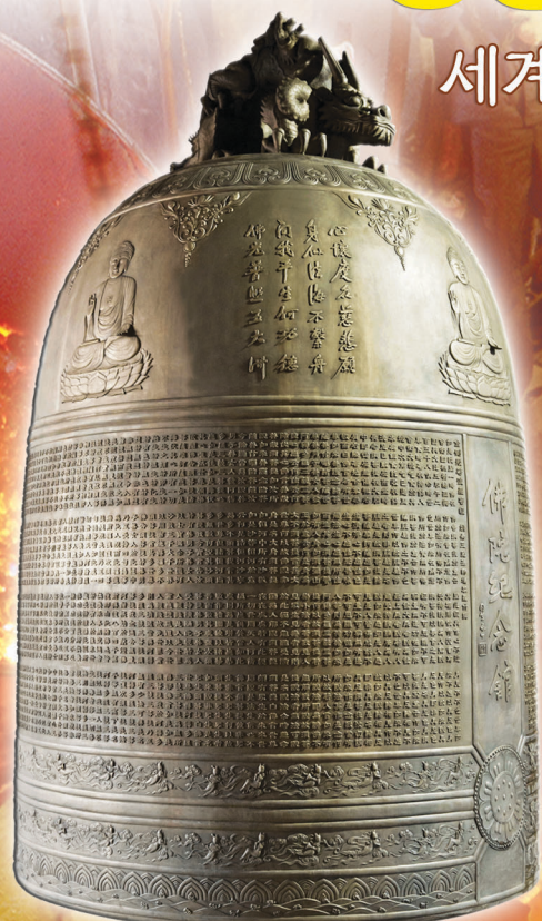
불광산사 범종 (중량 6700관)

성종사의 범종은 대만, 중국, 일본, 싱가포르, 홍콩, 베트남, 태국, 인도네시아, 말레이시아 등 전세계 불교권 국가로 수출되고 있습니다.