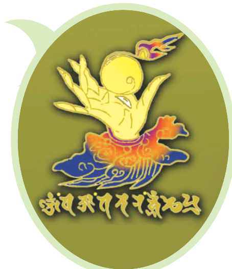
42수진언 족자 중의 '여의수주 진언' 확대사진