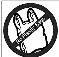
인도 비하르주에 있는 라지기르는 8대불교 성지이자 왕사성으로 최초 불교대학인 나란다 대학 등의 불교 유적이 많은 곳이다. 라지기르는 친환경 지역을 만들기 위해 비닐 백을 사용하지 말 것을 당부하고 있다. 사진은 나란다 대학 유적 일부(사진 왼쪽)와 비닐백 사용금지 표시.

인도의 8대 불교 성지이자 왕사성으로 널리 알려진 라지기르(Rajgir)가 ‘플리에틸렌’ 없는 ‘친환경 지역’으로 탈바꿈 할 전망이다.