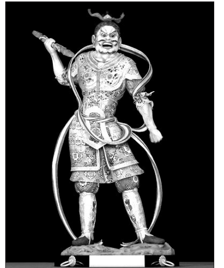
원형의 색을 돌리기 위해 조사작업에만 2년의 시간이 걸렸다. 컴퓨터 그래픽으로 화려한 모습을 되찾은 도다이지의 금강역사.

나라 시대(729~749)에 만들어진 것으로 추정되는 이 역사상은 1미터 73센티미터 길이로 일본 도다이지(東大寺)에 보관돼 일 년에 한 번씩 공개된다. 도다이지는 세계문화유산으로 등재된 길이 16미터의 대불과 세계최대의 목조건물로 유명하다.