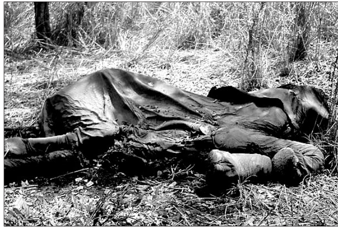
상아를 얻기위해 학살당한 코끼리들은 땅에 아무렇게나 널브러진다(사진 왼쪽). 그렇게 얻은 상아로는 불교 사원, 코끼리, 부처님 상 등 여러 불교 용품이 조각된다. (사진 오른쪽)

〈내셔널 지오그래픽〉지는 ‘상아 숭배(Ivory Worship)’라는 제목으로 “중국은