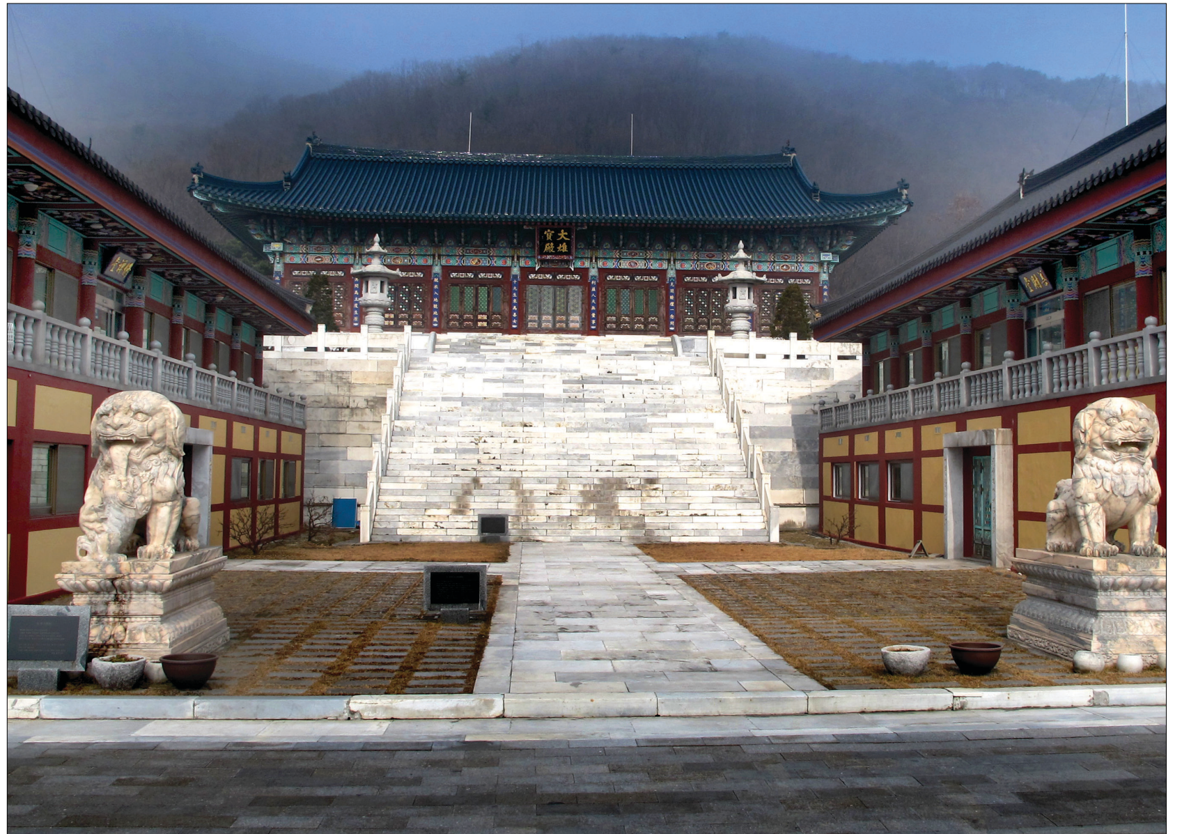
육지장사는 6만 지장보살상이 봉안된 지장도량이다. 사진 가운데 위에 보이는 것이 대웅전이고 좌우에 위치한 건물이 선재당과 수선당이다.