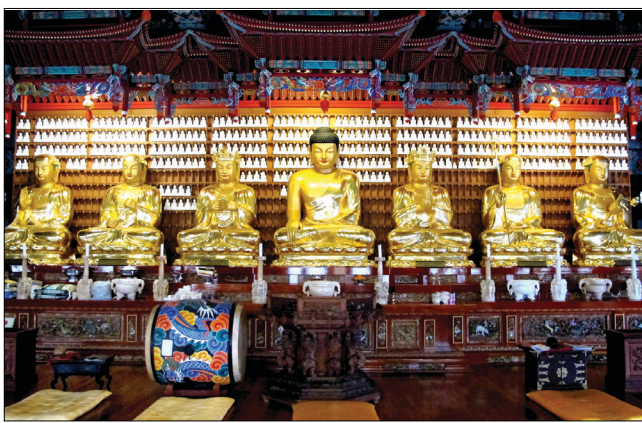
대웅전 안에 봉안된 육지장 보살. 가운데는 석가모니불이다.