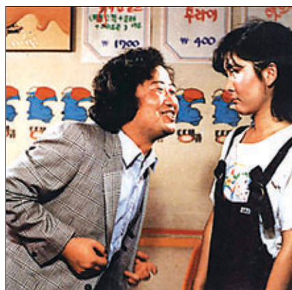
80년대 최고 인기를 누렸던 당시 활동 장면