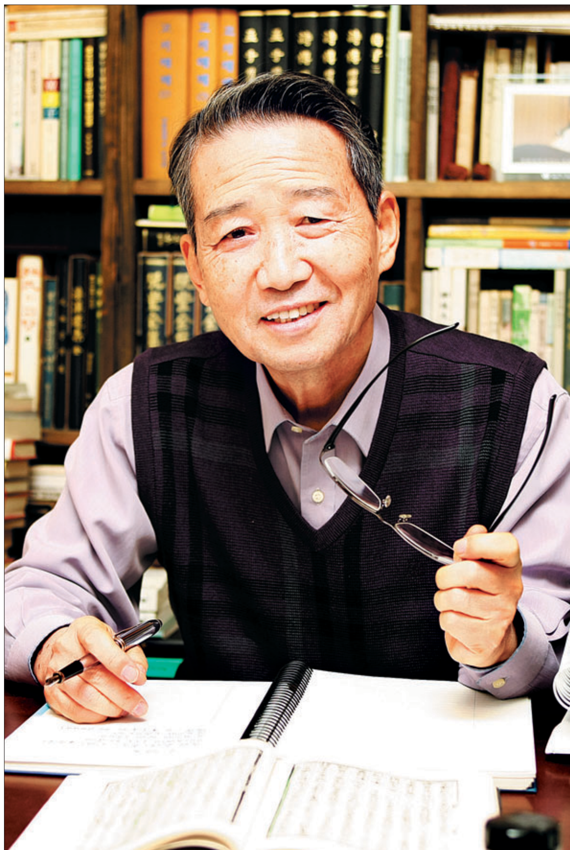
김병조 씨는 ... 1950년 전남 장흥 출생으로 광주고를 나와 중앙대 예술대 연극영화학과를 졸업했다. 동양방송(TBC) '살짜기 웃어예'로 개그맨 데뷔, MBC 일요일밤의 대행진 진행을 맡았고 청춘만세, 뽀빠뽀 등에 출연했다. 현재 방송인 겸 조선대학교 교육대학원 초빙교수 및 동대학 평생교육원 명예원장으로 활동하고 있다. 방송 80주년 유공 국무총리 표창, 문화방송 최우수 연기상 수상, 연예인 최초 저축유공 국무총리 표창, 프로듀서 연합회 선정 최우수 진행자상, 행원문화상 예술상 수상, 자랑스런 전남인상 등을 수상했다. 저서로는 수필집 <종가집 배추>가 있으며 현재 김병조의 <명심보감>을 집필중에 있다.