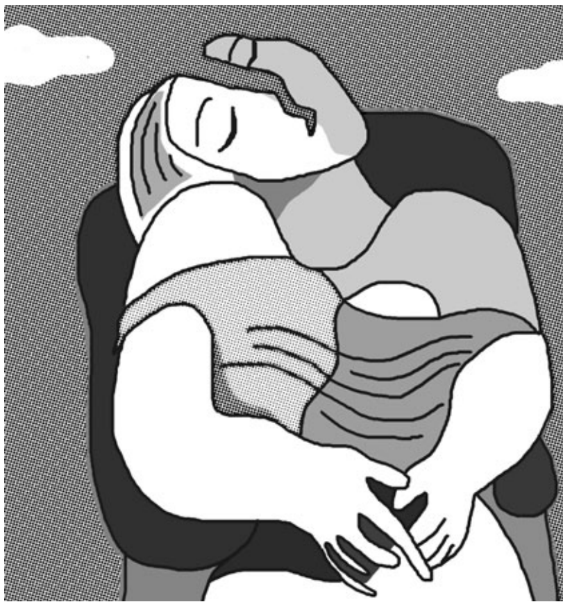
그림 · 박구원

문자 속에서 구할까?' 하였다. 지금 다만 자기 마음을 알아서 사랑 분별을 쉬기만 하면, 망상과 번뇌는 저절로 생겨나지 않는다. 유야 거사는 말하기를, '오직 침상 하나만 두고 병들어 누워 있다.'고 하였는데, 이는 마음이 일어나지 않는 것을 말한다. 지금 앉아누워서 반연을 모두 쉬어 망상이 그쳐 없다면, 그것이 바로 보리(菩提)다.