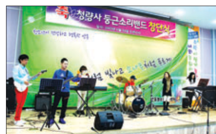
등근소리와 꼬마풍경 11월 24일 창단식 장면.