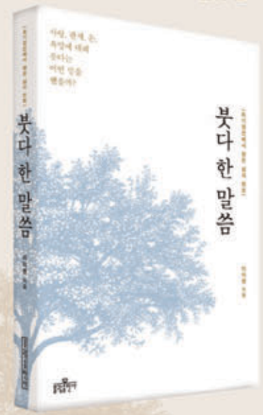
이미영 지음 | 248쪽 | 13,000원

세속적인 시대에 더욱 빛나는 붓다의 카운슬링 7년 동안 매주 목요일 저녁에 같이 읽고 함께 공감한 초기경전 속 생활의 지혜