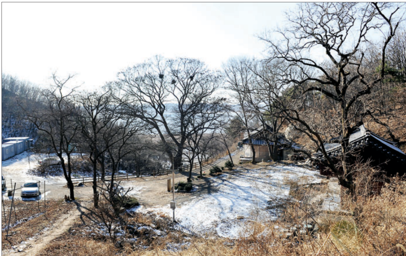
사찰화재를 막기 위해 건물 주변의 소나무를 제거하는 일이 불가피해졌다. 그러나 푸른색이 없는 산사의 겨울은 삭막하기만 하다. 경기도 3사찰