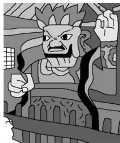
그림 · 박구원

신은 서원을 세우고 수행해서 공덕을 성취한 뒤에는, 즉 보신이 된 뒤에는 다시 중생을 제도하기 위해서 “능히 그 몸을 나타낸다”고 했으니, 이는 화신(化身)을 나타