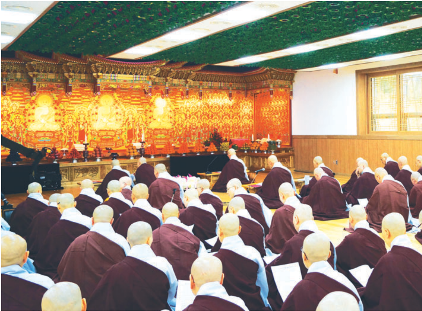
약사삼존불을 봉안하는 점안식 - 약사여래부처님과 좌우보처 일광불 일광변조보살님 월광불 월광 변조보살님께 스님들이 공양을 올리고 있다

중생의 병고에는 몇가지 원인이 있다고 했지요? 사대가 조화되지 않아서 오는 병은 병원에 가면 치유할 수 있어요. 그러나 업의 과보로 오는 업병은 치유할 수 없습니다. 또 귀신이 붙은 병은 못 낫습니다. 그런데 귀신이 붙었건 업병이건 사대의 조화가 되지 않아서 왔건 간에 약사부처님한테 오면 문제가 해결 되요. ...그래서 여러분한테 약사부처님이 계시는 이 약사궁을 찾아오라 그거예요. 기도도 붙이고, 오늘과 같이 약사재일날 함께 공양도 올리고 해라 그거요. (2013년 10월 12일 약사재일 자재만현 큰스님 소참법문 중에서)