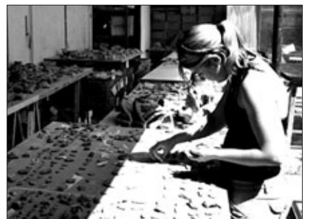
알파우드 재단이 동남아 불교와 힌두교 예술을 보존·연구하는 런던대 '동양 아프리카학회'를 지원하기로 했다.

이에 따르면 미국 시카고에 본부를 둔 알파우드 재단은 향후 20억 파운드(약 3조 5천억 원)를 연차적으로 SOAS에 지원한다. 이 기금은 SOAS 산하 80명의 학자들의 연구를 지원하는 데 사용되는 것은 물론 SOAS 산하 '아시아 예술 학교(School of Asian Arts)'의 운영을 위해서도 사용된다. 오종욱 편집위원