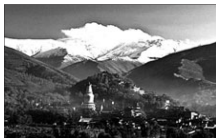
중국 4대 불교 명산 중 하나인 오대산 인근에 공항이 들어선다.

중국 최초의 사원인 낙양 백마사와 같은 해인 서기 68년에 창건된 현통사를 비롯, 당나라 때 지어진 불광사, 500개 대규모 조각상이 있는 수상사 등 53개 사찰을 품고 있다. 1세기부터 20세기까지 중국 불교 사원 건축 역사가 고스란히 녹아 있다. 또한 중국 내륙지역의 불교와 티베트 불교까지 공존하여 중국 불교의 축소판이라 할 수 있다. 건설에 우리나라 돈으로 1500억원 이상