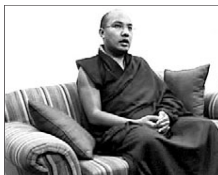
17대 칼마파 오겐 트린레 도르제(Ogyen Trinley Dorje) 스님. VOA 지와의 인터뷰에서 스님은 "인도·네팔 정부가 티벳 망명정부의 히말라야 수원 보호에 보조를 같이해야 한다"고 역설했다.

세계 야생 기금 후원 ... 17대 칼마파 '신성한 대지 프로그램' 운영 "인도·네팔·티벳 망명정부, 히말라야 수원 함께 보존해야"