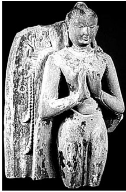
1989년 밀반출된 고대 불상이 미얀마로 돌아간다. 이번엔 반환되는 불상 일부는 미얀마의 대도시 바간 시 근교에 있는 사암 불상의 상단 부분으로 알려졌다.