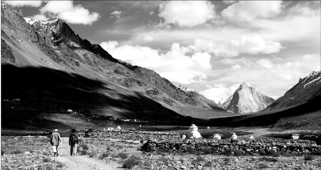
26년째 히말라야에서 지내온 청전 스님은 히말라야를 닮은 맑고 밝은 사람의 얼굴에서 행복의 비밀을 찾아냈다.

저자가 26년째 머무는 북인도의 다람살라는 달라이 라마와 티베트 난민들의 거주지다. 그곳에는 이루 말할 수 없는 고행을 겪으며 히말라야 설산을 맨몸으로 넘어온 난민들의 자연이 수두룩하다. 티베트의 독립을 위해 투쟁하던 세 비구니 스님은 중국의 감옥에서 극악무도한 성폭행에 시달리다 히말라야 설산을 넘어왔다. 그 후 양심의 가책 때문에 더 이상