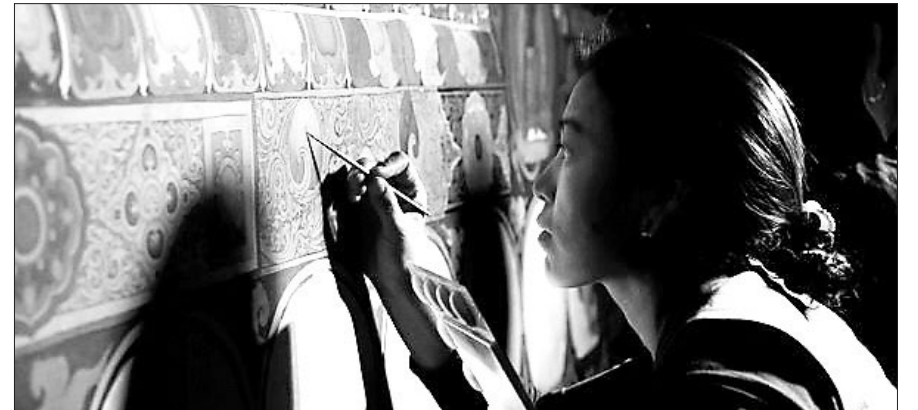
툽첸 수도원에서 무스탕 지역민이 벽화 복원 작업을 하고 있다.

히말라야 해발 3800M 고원 지대에 위치한 무스탕, 티베트 문화가 살아있는 이곳은 14~17세기까지 티베트 불교의 중심지였다. 그러나 18세기 네팔에 합병된 후 외부 방문이 금지되었고, 1950년대 중국의 티베트 점거에 맞서 티베트인들이 이곳을 근거지로 삼자 무스탕으로 이르는 통로는 모두 차단됐다.