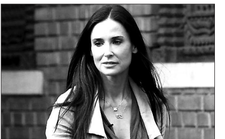
할리우드 스타 데미 무어가 불교에 관심을 보이고 있다.

〈타임즈 라이브〉지는 무어의 말을 인용, "이번 회의에서 달라이 라마와의 깊은