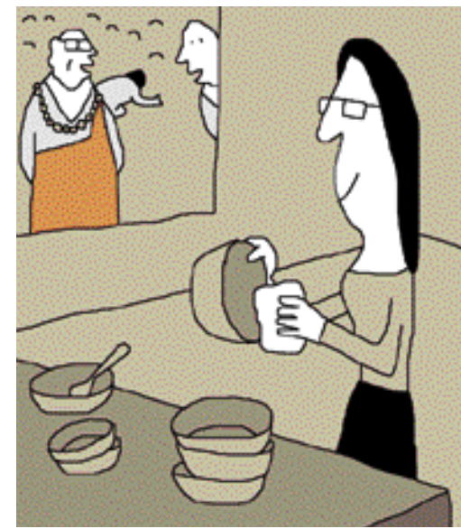
그림 · 박구원

당시 스님께서 그 센터를 운영하고 있었다. 그 후로 인연이 되어 스님을 돕게 됐다. 얼마동안 나를 지켜보신 스님들은 출가를 권했다. 하지만 당