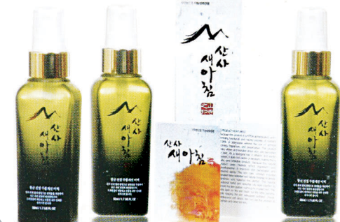
식약청 인정 및 특허제품 (특허 제 10-1230922호)