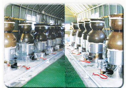
△용기 소켓고리에서 증류로 받는 원료들

(주)산사새아침 생약 발효화장품 스킨케어 제품은 기본재료를 1년이상 숙성 발효하여 용기 소켓고리에서 12~13시간을 거쳐 증류로 받는 원료 그대로를 제품화 하였습니다. 특히, 아토피, 여드름, 기미, 주름개선, 미백, 트러블에 좋은 화장품으로 식약청 인정 및 특허제품입니다. '산사새아침' 제품의 천연 원료는 우리나라 토종 지렁이인 참지렁이(red worms)를 직접 사용하여 1년이상 땅속에 묻어 숙성 과정을 거쳐 우리네 선조들의 전통 전례법제 공법인 용기(소주고리)로 한 방울씩 모아 하루 약 12시간 증류하여 제조한 것입니다.