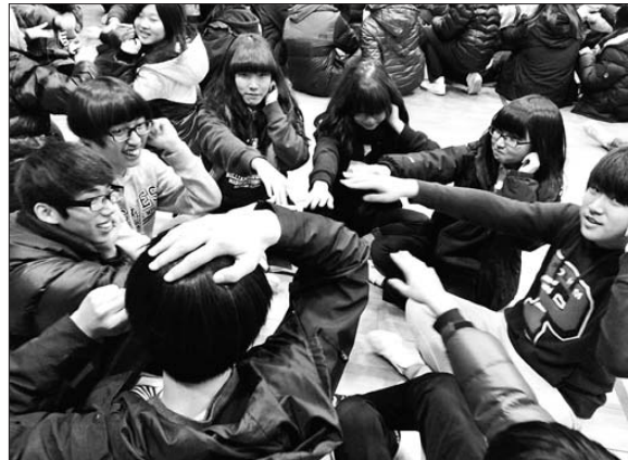
시립목동청소년수련관은 신청학교에 직접 방문해 수험생들이 미래설계를 할 수 있는 프로그램을 진행하며(사진 왼쪽), 대원사는 명상, 돌레길 걷기, 스님과의 차담을 포함한 템플스테이를 진행한다(사진 오른쪽).

목동청소년수련관은 중·고3 수험생을 위해 청소년들이 내재돼 있는 리더십을 발견할 수 있는 '자기표현 및 리더십', 자신의 강약점을 파악해 미래를 설계할 수 있도록 하는 '미래인생설계 셀프리더십', 학업별 모둠 활동을 통해 스트레스를 날릴 수 있는 활동형 프로그램인 '긍정커뮤니케이션과 웃음치료' 등 다양한 활동을 진행한다.