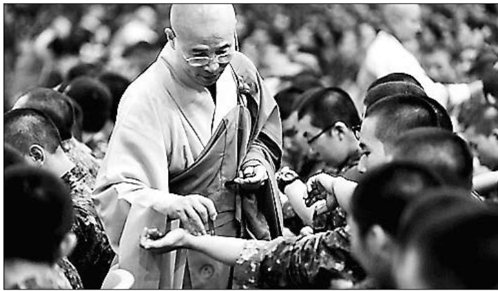
호국연무사 수계법회에서 3600여 훈련생들에게 연비의식이 거행됐다.

청년 포교의 핵심이며 군포교 최대 전법도량인 논산 육군훈련소 호국연무사에서 수계법회가 10월 19일 거행됐다. 이날 수계법회에는 봉은사 주지 진화 스님이 계사로 초청돼 3