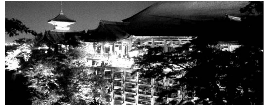
일본 유명 사찰 키요미즈 사원이 사원의 모든 전등을 LED로 교체해 '분홍빛 사원'으로 관광객들에게 다가간다.

본의 유명 사찰 키요미즈(Kiyomizu Buddhist Temple)의 스님들이 성공적인 '분홍빛 포교'를 전개하고 있다.