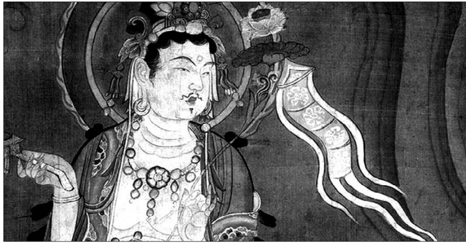
영국에서 2014년 1월 19일까지 '중국 회화의 최고 걸작전'이 열린다. 이번 전시에는 돈황막고굴의 불교예술을 중심으로 진행된다.

이곳에서 막고굴과 같은 동굴 사원이 처음 들어선 것은 약 350년. 그 후 해상 항로의 발달로 실크로드의 필요성이 감소하면