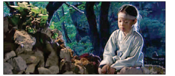
드라마 ‘대장금’에서 장금이 어머니 돌무덤을 쌓고있다.

극락보전 옆으로 난 길을 따라 오르면 도솔천내원궁이 있다. 지장보살좌상(보물 280호)을 모셨다. 도솔암은 미륵도량인 동시에 지장도량인 것이다. 험준한 바위 위에 세운 법당으로 상도솔암이라고도 한다. 도솔천내원궁을 내려와 나한전을 끼고 돌면 도솔암마애불을 만날 수 있다. 도솔암 서편 암벽에 모신 마애불은 높이 13m, 너비 3m에 이르는 거대한 불상이다. 전설에 의하면 백제 위덕왕이 검단산사에 게 부탁하여 암벽에 불상을 모시고 동불암이라는 공중누각을 짓게 했는데, 조선 영조 때 무너졌다고 한