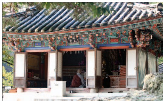
도솔천에 내원궁이 있듯이 도솔암에도 내원궁이 있다.

“장금이, 수라간 최고 상궁이 되어다오.” 어머니 열네 어머니가 마지막으로 드신 산딸기가 놓여있다. “어머니, 이제 저 갈래요.”