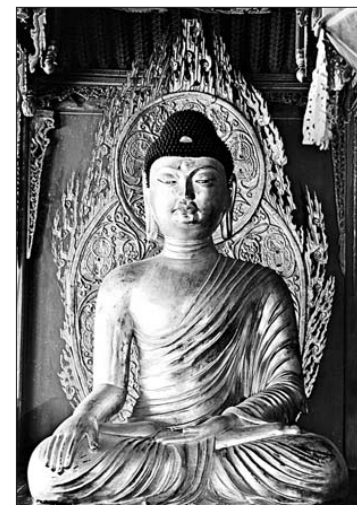
영주 부석사 소조불상(국보 제45호)

이 연구원은 이어 “부석사 소조불좌상의 상호가 안압지 금동팔발 등 통일신라 초기 불상들과 닮았다”며 부석사계 불상이 신라말 궁에 세력이었던 중부류 중심