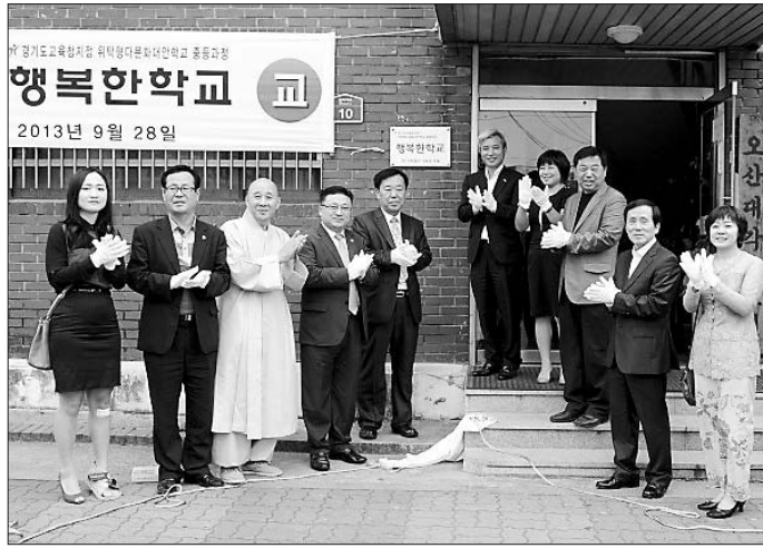
다문화 가정 청소년들을 위한 대안학교인 오산 '행복한 학교'가 지난 9월28일 개교했다(사진 왼쪽). 반갑다 연우아는 11월 초까지 다문화가정 및 국내에 거주하는 이주민을 위한 통합진료와 독감백신 접종을 실시한다. 사진은 반갑다 연우아 의료봉사 활동 모습(사진 오른쪽)