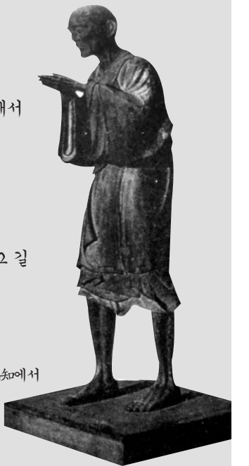
2013년 9월 29일 고치에서

이제 가시는 것입니까 팔백년 미뤄두셨던 길, 왕생의 여정 떠나시는 것입니까 나무아미타불, 나무아미타불 두 손 모아서 온 중생을 향해서 허리 굽혔던 그 자세